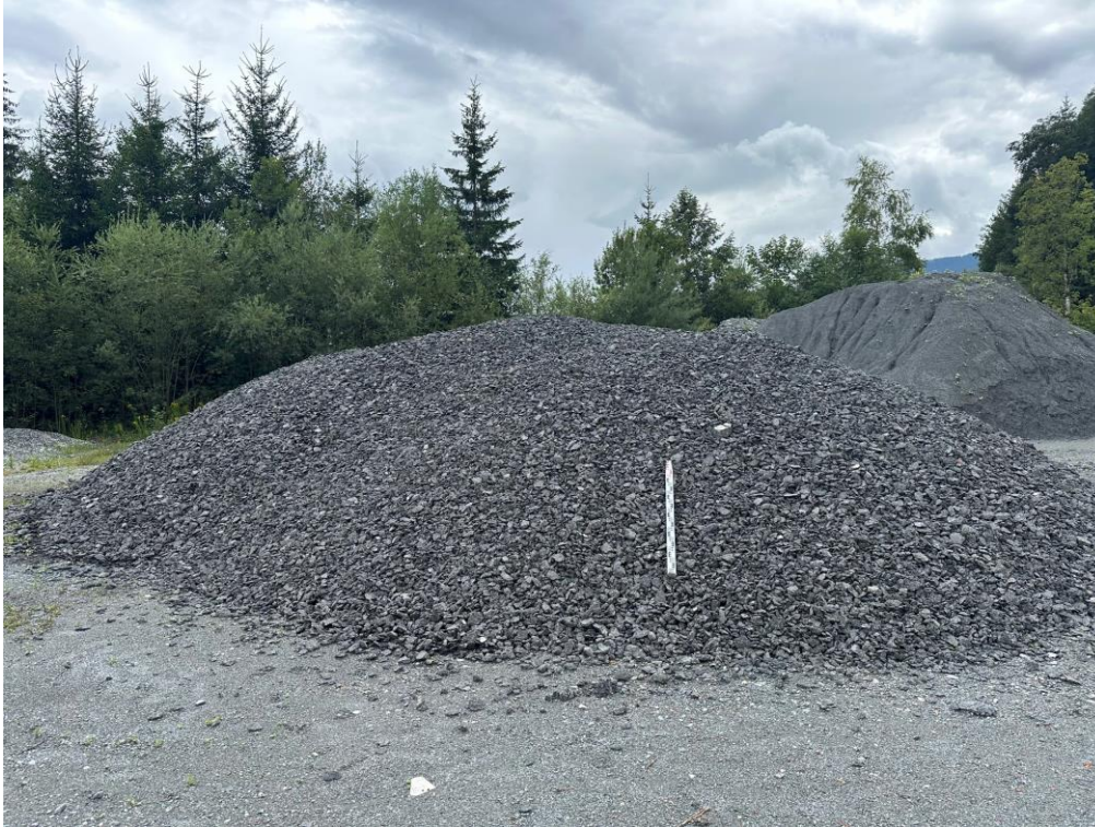
Abbildung 1 - Haufwerk