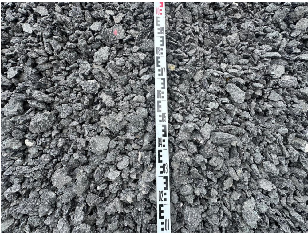
Abbildung 2 - Detailaufnahme des Materials